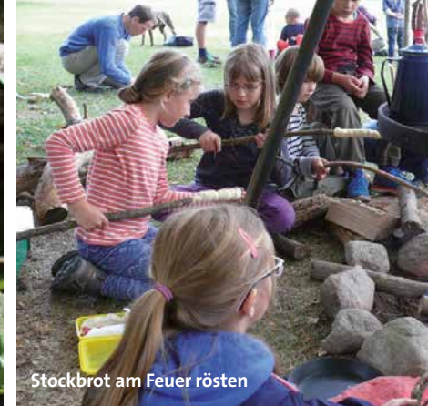
Stockbrot am Feuer rösten